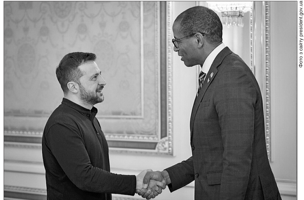
Володимир Зеленський подякував Греггові Фергюсу за рішення надати 5 млрд канадських доларів коштом прибутків від заморожених російських активів

Грег Фергюс наголосив, що візит представників усіх партій Палати громад свідчить