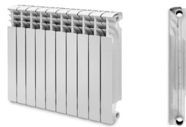
Орієнтовний типовий зовнішній вигляд сталевих радіаторів

Орієнтовний типовий зовнішній вигляд алюмінієвих та біметалевих радіаторів