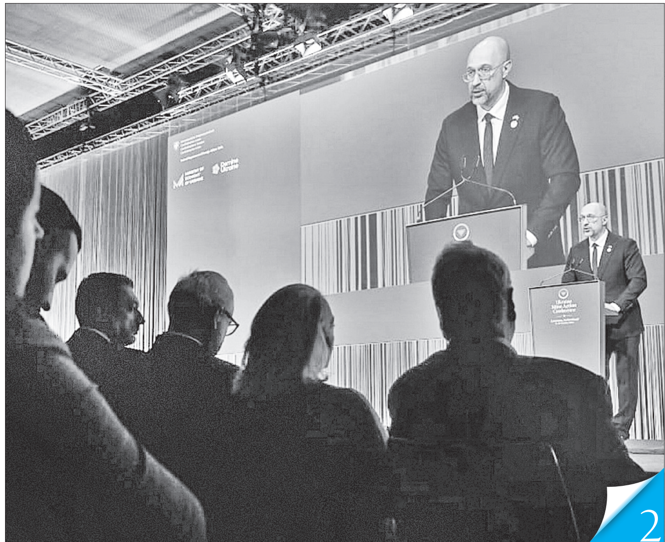
Денис Шмигаль у виступі озвучив важливу мету: щоб до 2033 року Україна була чистою від мінного сміття

БЕЗПЕКА. У Лозанні урядова делегація на чолі з Прем'єр-міністром бере участь у Конференції з питань протимінної діяльності в Україні