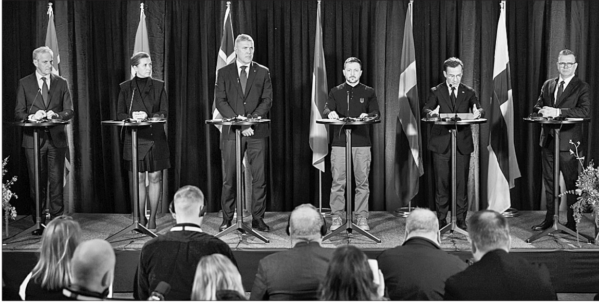
28 жовтня в Рейк'явіку прем'єр-міністри країн Північної Європи та Президент України зробили спільну заяву

Саміт Україна — Північна Європа у Рейк'явіку уже четвертий у такому форматі. Третій відбувся у Стокгольмі (Швеція) цього року у травні. Два попередні