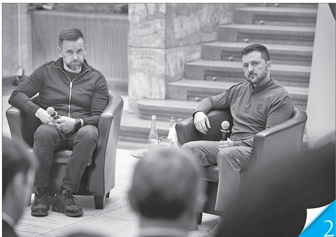
В Ужгороді Володимир Зеленський поспілкувався також з керівниками місцевих територіальних громад і районів

«З початку повномасштабного вторгнення 2022 року газовидобування галузь зіткнулася з численними викликами, серед яких зупинка робіт на багатьох родовищах на сході країни через бойові дії. Війна не лише створила складні умови для видобутку, а й стимулювала важливі реформи та інвестиції, спрямовані на підвищення енергетичної безпеки держави», — зазначив заступник міністра, повідомляє Міненерго.