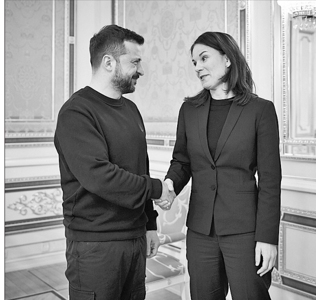
Володимир Зеленський подякував Анналені Бербок за те, що вкотре приїхала підтримати нашу країну в боротьбі з агресором

За словами Андрія Сибіги, Україна високо цінує і вважає