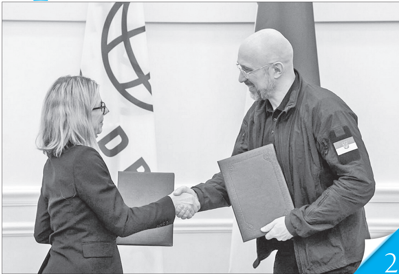
Денис Шмигаль і керівний директор Світового банку з питань операційної діяльності Анна Б'єрде обговорили фінансування проєктів

КООРДИНАЦІЯ. Прем'єр-міністр підписав від імені уряду меморандум про взаєморозуміння з Міжнародним банком реконструкції та розвитку