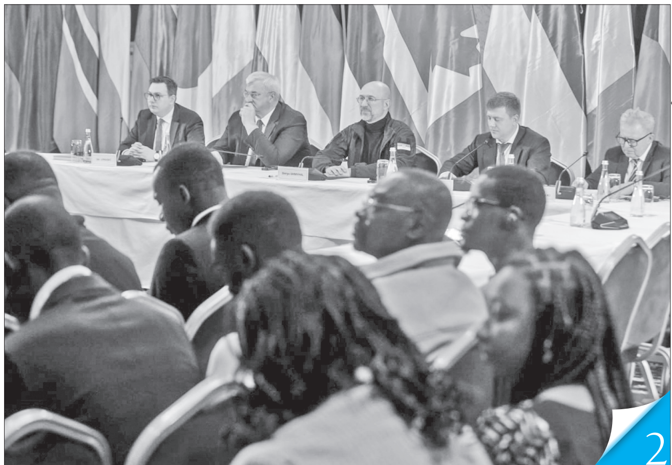
Традиційний листопадовий захід об'єднав світових лідерів, міністрів, представників міжнародних організацій та провідних експертів

ВАЖЛИВА ПЛАТФОРМА. У Києві відбувся третій Міжнародний саміт з продовольчої безпеки