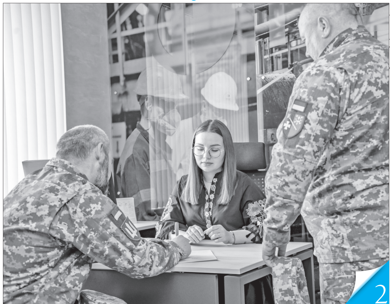
Один з найважливіших напрямів — всебічна допомога ветеранам під час переходу до цивільного життя

ФОРУМ. Уряд активно сприяє реалізації програм ментального здоров'я в Україні