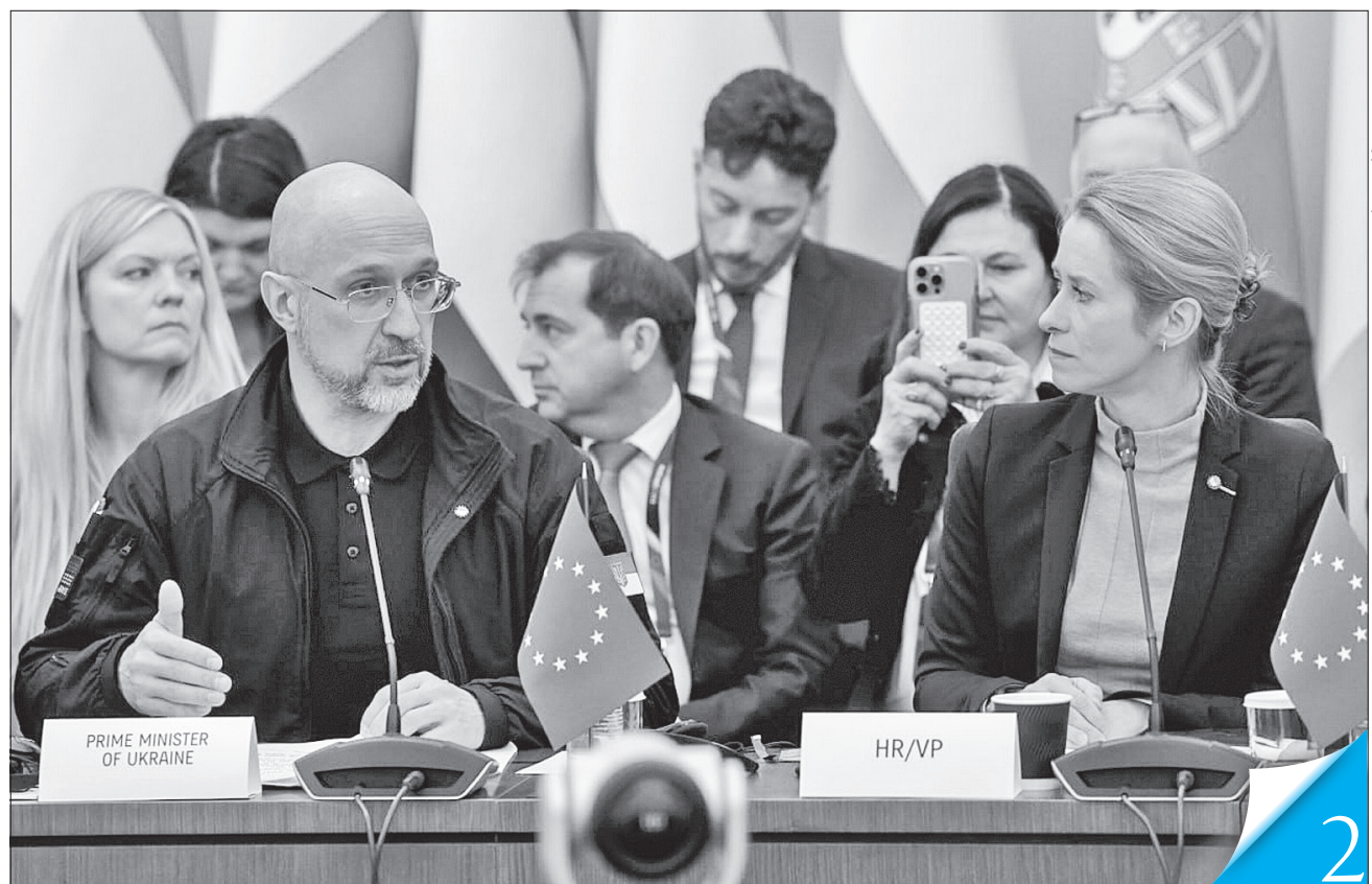
Прем'єр-міністр Денис Шмигаль і високий представник ЄС Кая Каллас підтвердили стратегічне партнерство між Україною та Європейським Союзом