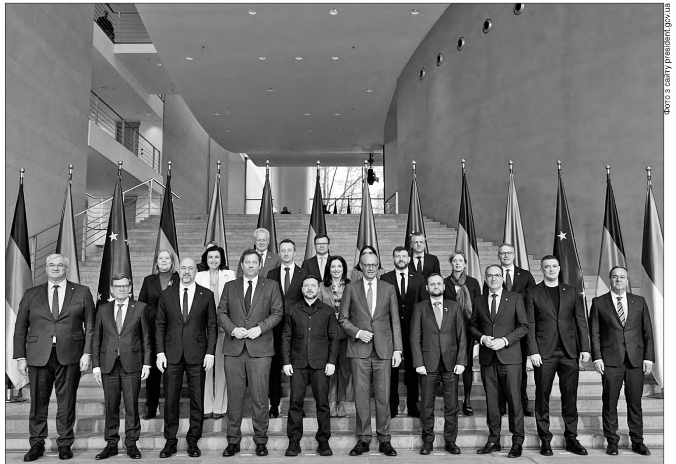
У Берліні за головуванням Володимира Зеленського і Фрідріха Мерца вперше за понад 20 років відбулися міжурядові консультації