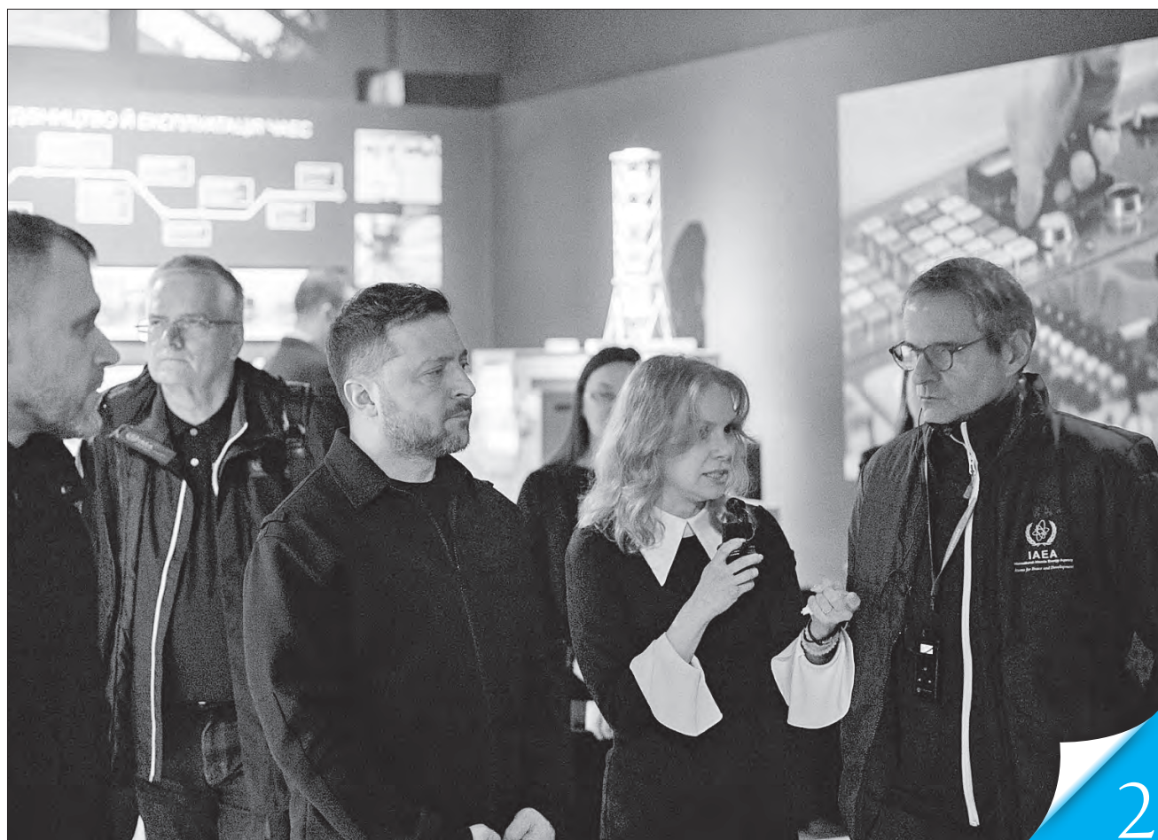
Володимир Зеленський і генеральний директор МАГАТЕ Рафаель Гроссі побували на відкритті нової постійної експозиції Національного музею «Чорнобиль»

ПАМ'ЯТЬ. Президент та Прем'єр-міністр України взяли участь у заходах з нагоди сорокових роковин Чорнобильської катастрофи