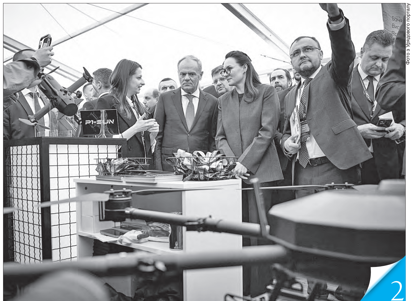
Прем'єр-міністр Юлія Свириденко під час візиту в Польщу повідомила, що URC вперше матиме окремий оборонний вимір

ДОБРОСУСІДСТВО. Україна та Польща готуються до проведення Ukraine Recovery Conference , яка відбудеться в червні цього року