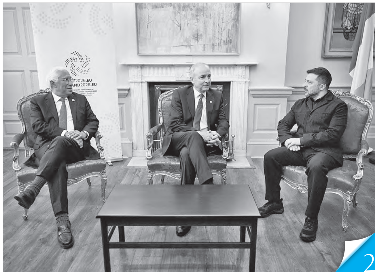
У Дубліні відбулася трестороння зустріч Президента Європейської ради Антоніу Кошти, Прем'єр-міністра Ірландії Мікхала Мартіна і Президента Володимира Зеленського

КРОК ЗА КРОКОМ. У цьому півріччі Україна розраховує на реальний прогрес у переговорах про вступ до Європейського Союзу