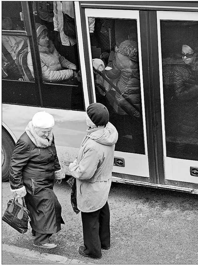
На пільговиків перевізники нерідко дивляться зверхньо. Як буде цього разу?

Однак, як виявилось на нараді, проблема не тіль-