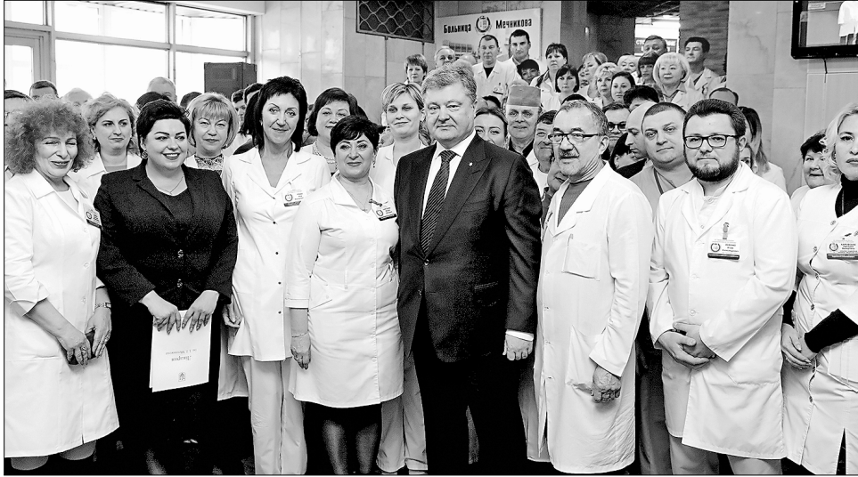
Дніпровські лікарі щодня рятують життя українських бійців. Уклін їм за подвиг

«Може наголосити, що таких лікарень в Україні поки що одиниці. Тут усе, як у найкращих лікарнях Європи: нові обладнання, технології. Для відділення купили надсучасний апарат штучної вентиляції легенів. Подбали про незалежну систему живлення: три джерела електрики — у будь-якій ситуації відділення буде зі світлом і зможе працювати. Приміщення обладнане надсучасною системою клімат-контролю й вентиляції, які забезпечують температуру повітря і вологість, необхідну немовлятам. Система нейтралізує і запобігає поширенню бактерій», — вдався до подробиць глава держави. Після цього передав у подарунок медичному закладу апарат для проведення екстракорпоральної мембранної оксигенації.