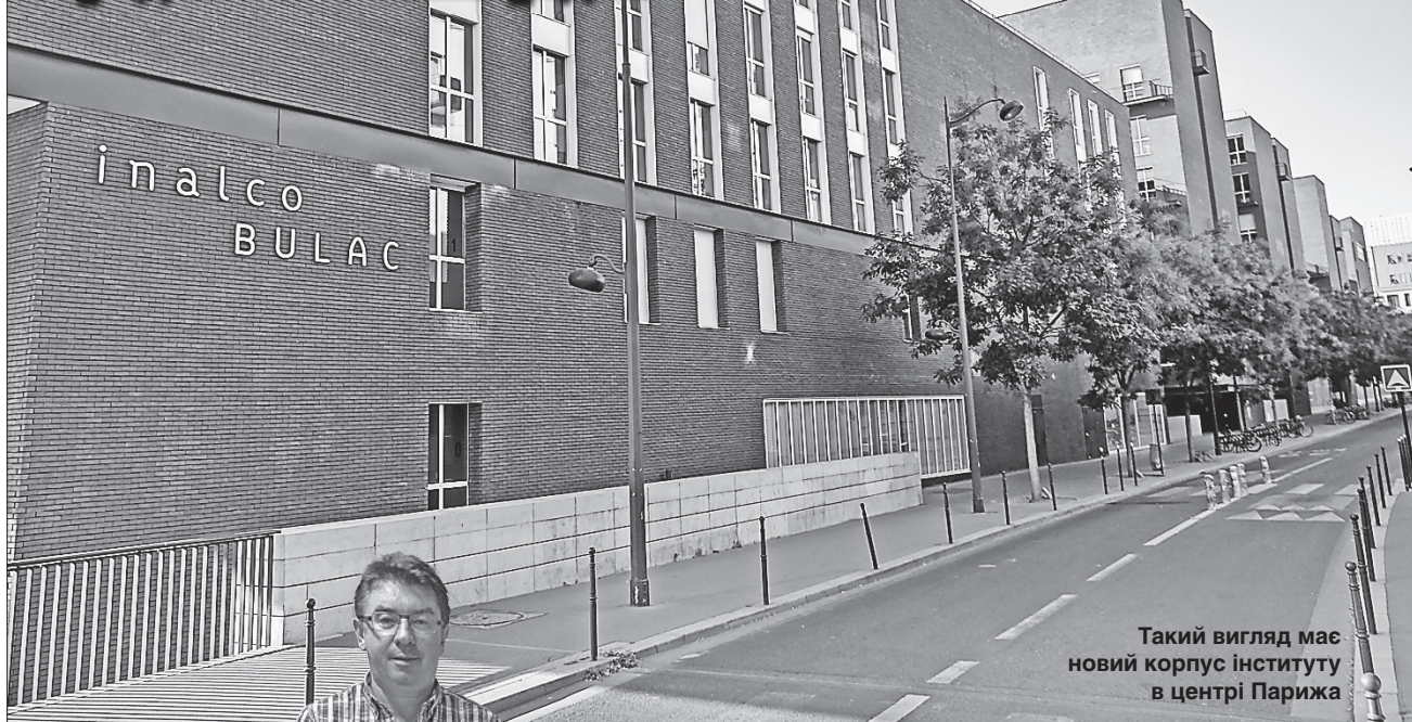
Такий вигляд має новий корпус інституту в центрі Парижа

ЗНАЙ НАШИХ! У Національному інституті східних мов і культур (Франція) вивчають близько ста мов, серед яких і наша рідна