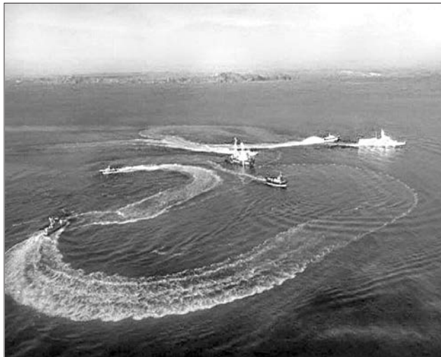
Піратські маневри росіян у Чорному морі не вдасться приховати від світової громадськості

Тож не треба робити з цього якоїсь сенсації та перекладати з хворої голови на здорову, звинувачуючи її у навмисних намірах заподіяти шкоду у вигляді порушення кордону РФ. Те, що Азовське море й Керченська протока — водойми спільного користування України та РФ і наші кораблі мають цілком законне право перебувати там, давно всім відомо. Відповідну угоду від 2003 року обидві сторони не денонсували. Навіть якщо чисто гіпотетично уявити юридичну, за всіма міжнародними нормами, належність окупованого й анексованого Криму до РФ, то й у цьому разі прохід протокою має бути вільний і