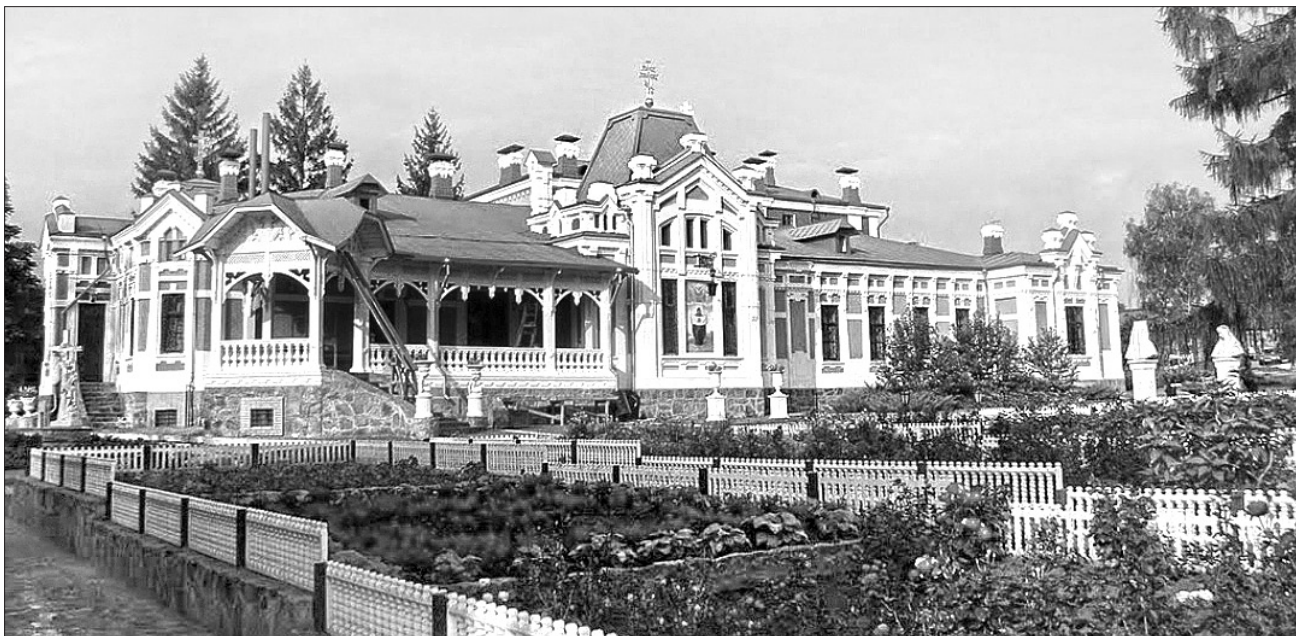
Ризоположенський монастир — справжня окраса Томашівки. Він зробив відомими фастівчан в Україні. У селі сподіваються, що після напливу туристів вони стануть ще й заможними