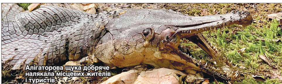
Алігаторова щука добряче налякала місцевих жителів і туристів