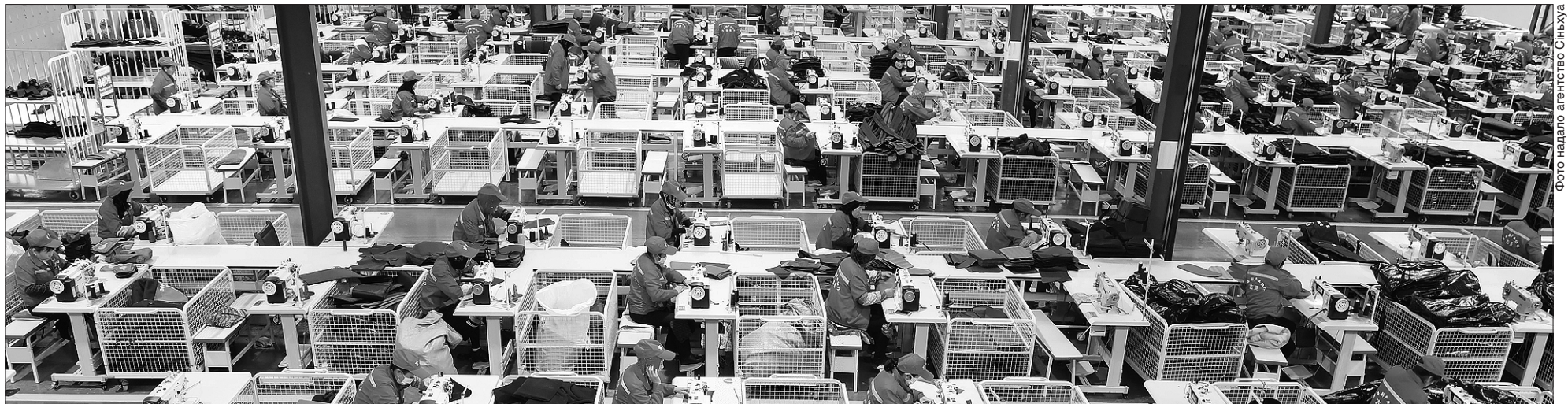
Робітники на лінії з виробництва сумок у цеху по боротьбі з бідністю в повіті Хечжен

СТАЛИЙ РОЗВИТОК. Днями агентство Сінхуа представить доповідь, в якій буде висунуто нову концепцію «скорочення бідності як наукової дисципліни»