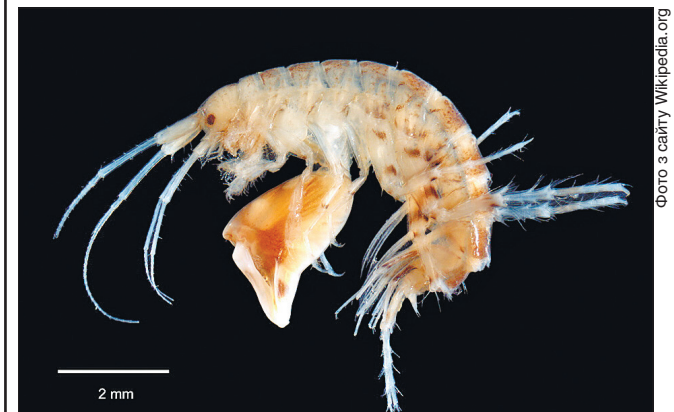
Морський рачок з роду Dulichella

Бокоплави, або різноногі, належать до групи вищих раків. Вони невеликі, зазвичай не більш як сантиметр завдовжки. Бокоплави Dulichella cf. appendiculata харчуються мертвими водоростями. Навіщо вони клацають клешнею, дослідники не знають, але припускають, що це може бути спосіб комунікації: самці можуть повідомляти самок, де вони перебувають, і водночас попереджати інших самців-конкурентів, щоб вони не зазіхали на їхню територію.