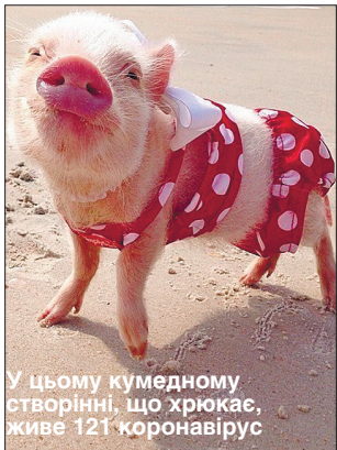
У цьому кумедному створінні, що хрюкає, живе 121 коронавірус

вірусів є ближчі й даліші види, і коронавіруси тут не виняток. Два близьких коронавіруси з великою ймовірністю можуть інфікувати один і той самий вид тварин. Такий аналіз робили не вручну, а за допомогою алгоритмів.