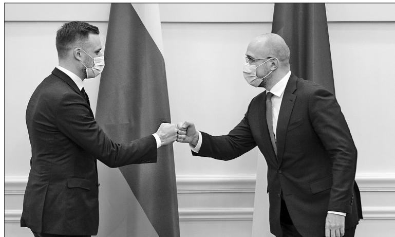
Міністр закордонних справ Литовської Республіки Габріелюс Ландсбергіс (ліворуч) запевнив: Литва готова надати Україні частину вакцин у межах ініціативи Європейської комісії для країн «Східного партнерства»

Габріелюс Ландсбергіс зазначив, що Литва готова надати Україні частину вакцин у межах ініціативи Єврокомісії для країн «Східного партнерства».