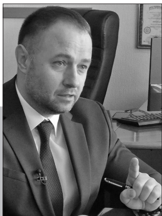
Директор департаменту соціальної політики КМДА РУСЛАН СВИТЛИЙ

Чи можна оформити соціальну виплату як малозабезпечену сім'ю? На даний час не працюю. Діти отримують аліменти, платить держава, оскільки перший чоловік не платить. Я зараз у шлюбі, чоловік офіційно не працює, тато пенсіонер, мама не працює.