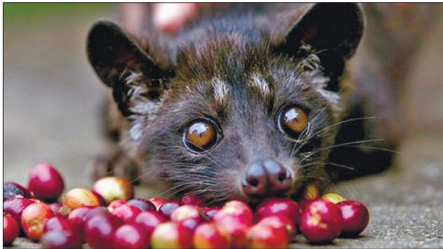
Мусанг, малайзійська пальмова куніця

Порівнявши гени двох вірусів, можна зрозуміти, наскільки відрізняються їхні господарі. У будь-якій групі