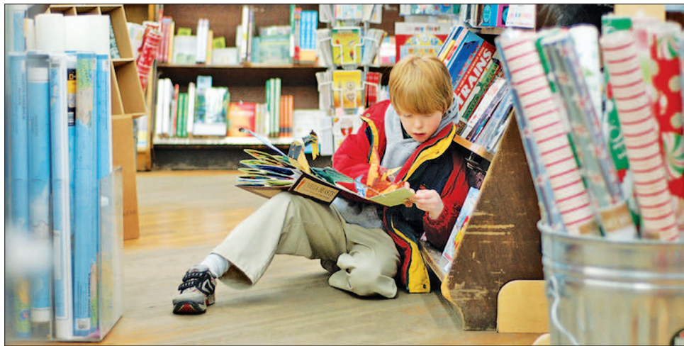
Тиждень читання відкрив для дітей цілий світ досі не пізаного

Однак такий стан речей негативно позначається на дитячому розвитку, адже,