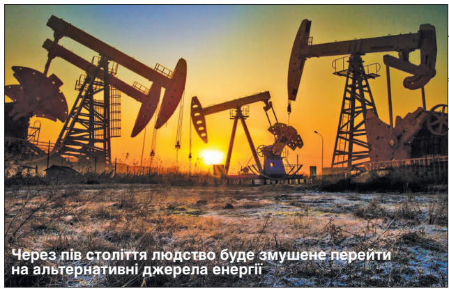
Через пів століття людство буде змушене перейти на альтернативні джерела енергії

На тлі пандемії коронавірусної інфекції й падіння попиту найбільші виробники нафти уклали угоду про рекордне зниження видобутку на 9,7 мільйона барелів на добу в межах угоди ОПЕК+, яка буде чинною два роки — з 1 травня 2020-го до початку травня 2022-го. Про скорочення домовилися і країни G20, які не входять в ОПЕК+, зокрема США і Канада. Внаслідок цього сумарне зниження видобутку в світі може становити приблизно 19 мільйонів барелів на добу, або майже 20%, вважають фахівці.