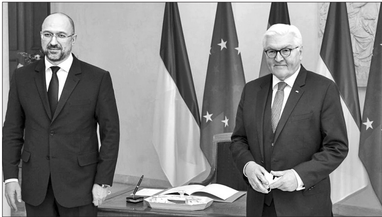
Президент ФРН Франк-Вальтер Штайнмаєр (праворуч) задоволений плідною зустріччю з Денисом Шмигалем

Окремо очільник українського уряду наголосив, що членство України в НАТО істотно посилить східний фланг Альянсу та зміцнить загальноєвропейську безпеку загалом. Наша країна сподівається на підтримку Німеччини в питанні надання нашої державі Плану дій щодо членства в НАТО.