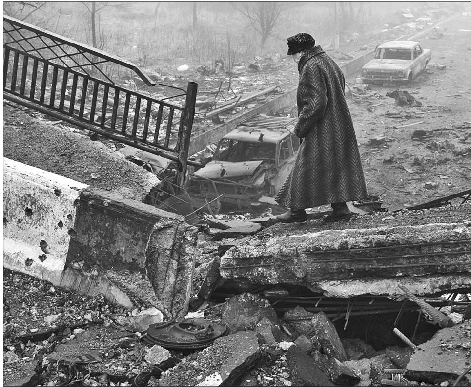
На окупованій території Донбасу лихий час неможливо зупинився

Ідеться про новий навчальний заклад, у якому зможуть