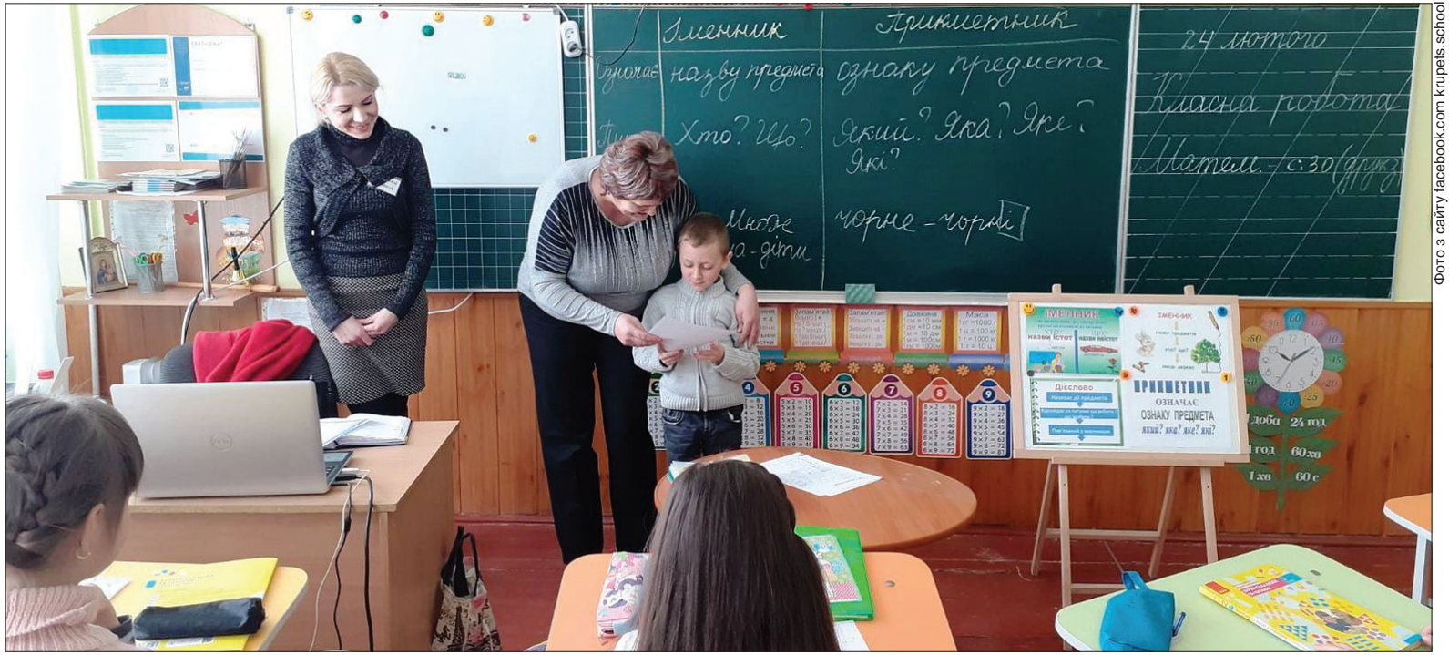
В опорному закладі «Крупецька ЗОШ I-III ступенів» застосовують сучасні методи організації освітнього процесу

Цій громаді як першопрохідцеві децентралізації коштом так званих підйомних від держави в попередні роки вдалося модернізувати заклади освіти. Нині тут усюди енергоощадні вікна, двері й дахи, утеплють все, що могли, істотно скоротивши витрати на енергоносії. Економія, здається, вже оселилася в крові у крупцівців. Понизили