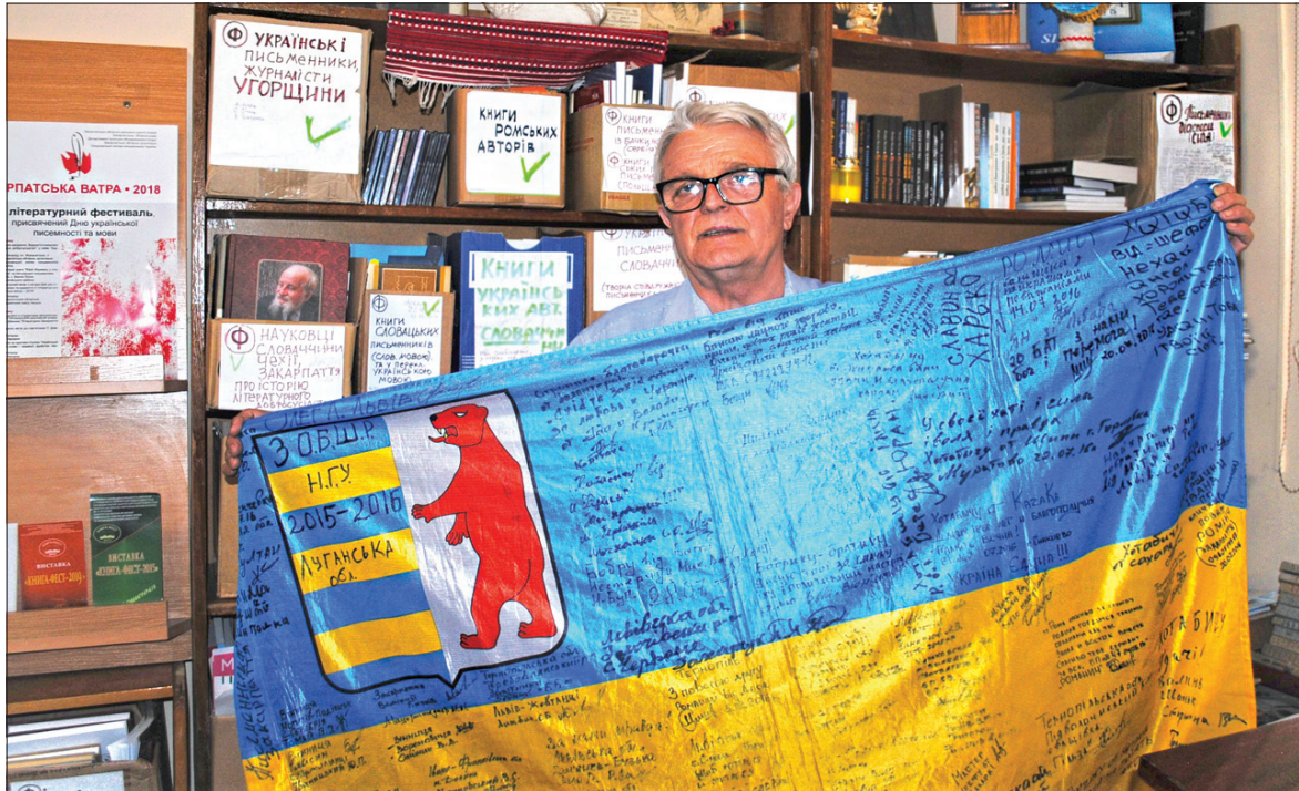
У музеї зберігається прапор зі сходу України, який подарували бійці-атовці, з автографами

За два роки кількість експонатів зросла від 800 до понад 4 тисяч. Це і книжки, і рукописні твори, ав-