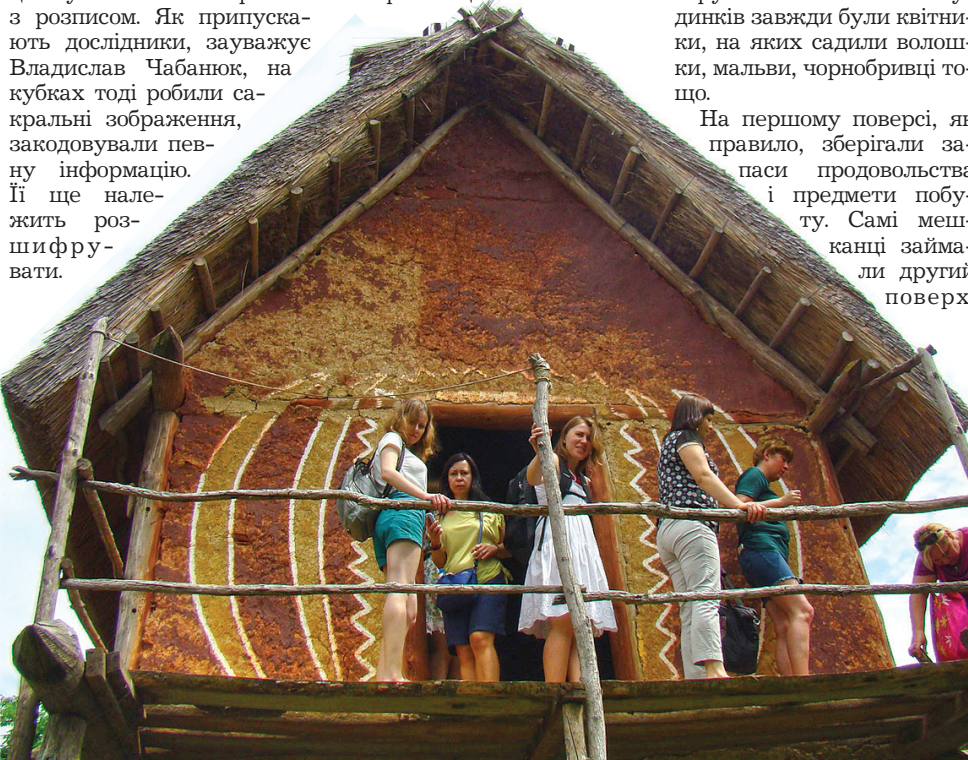
Побувати у відтвореній ентузіастами хаті предків — особливі відчуття

Як стверджують науковці, ці поселення можна вивчати роками, та нині їх слід зберегти. Десять років тому дослідження нашим науковцям допомагали проводити німецькі геофізики. Завдяки сучасній техніці вдалося побачити, де містилася кожна трипільська хата з точністю до 10 сантиметрів. До речі, як виявили німці, найбільшу кількість меду збирали саме трипільці.