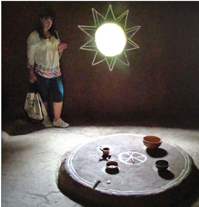
У давньому будинку стіл — центр родини, як і зараз у нас

На околицях Легедзинового уже не один десяток років розкопують найбільше у світі поселення часів Трипільської культури. Знайдений тут посуд, фрагменти інструментів праці, наконечники стріл, гачки та багато інших артефактів лягли в основу музею. Відомо понад 2000 трипільських поселень, з яких три десятки гігантів площею більш як 100 гектарів. Відкриття цих поселень в 1960-ті роки стало науковою сенсацією. Більшість гігантів розташовано на Черкащині, що