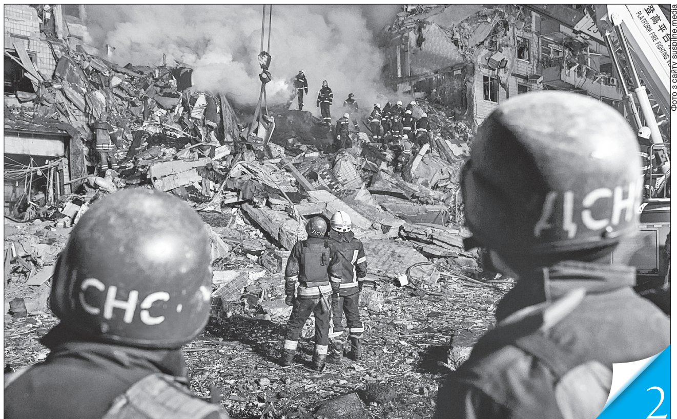
У Дніпрі 14 січня ворожа ракета влучила у дев'ятиповерховий будинок, зруйнувавши два під'їзди з дев'ятого по другий поверхи (72 квартири знищено, понад 230 пошкоджено)

СВІТ БАЧИТЬ. І ХАЙ ПОЧУЄ. Україна потребує більше зброї та ППО, щоб захистити життя своїх громадян від агресії терориста-сусіда