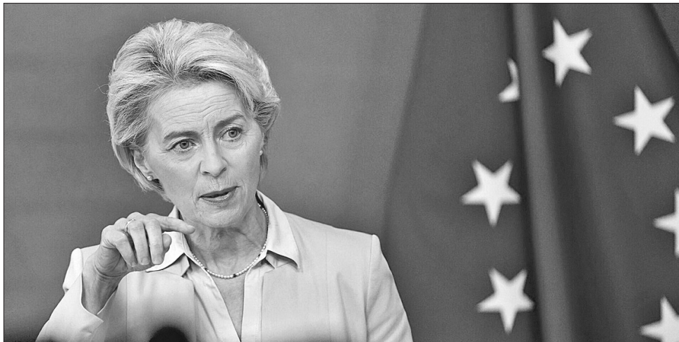
Очільниця Єврокомісії Урсула фон дер Ляен оголосила, що ЄС збирається запропонувати нові санкції і проти білорусі за причетність до російської агресії

Щодо десятого санкційного пакета проти росії, то в нього заплановано ввести обмеження щодо ядерної енергетики. Обмеження на співпрацю ЄС з росією у цій галузі вже не вперше опиняються на столі переговорів під час формування антиросійських