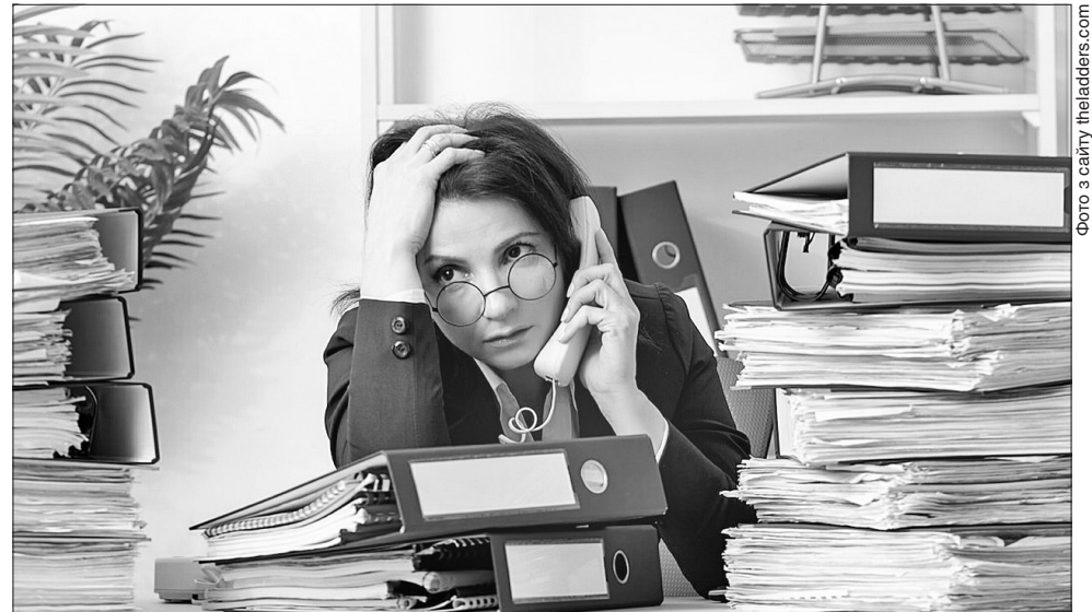
Платникам податків радять перед наданням відповідних документів самим перевірити чи належно вони оформлені

Уряд дозволив здійснювати такі перевірки всім контролюючим органам. Нині це 40 центральних