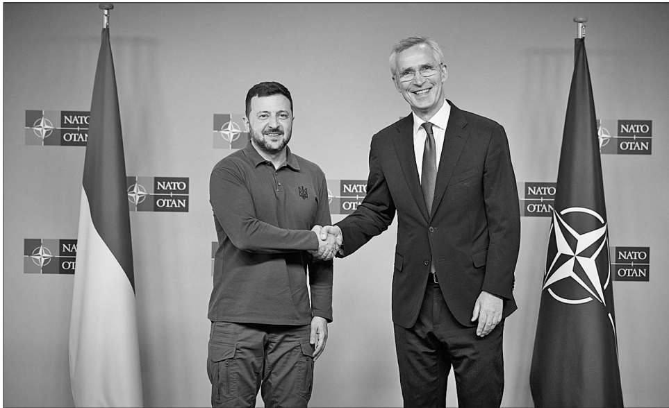
Володимир Зеленський подякував Єнсу Столтенбергу за послідовні зусилля із залучення союзників до допомоги Україні

Артилерія, снаряди, дотримання кожної обіцянки важливі не лише з огляду на захист життів, але