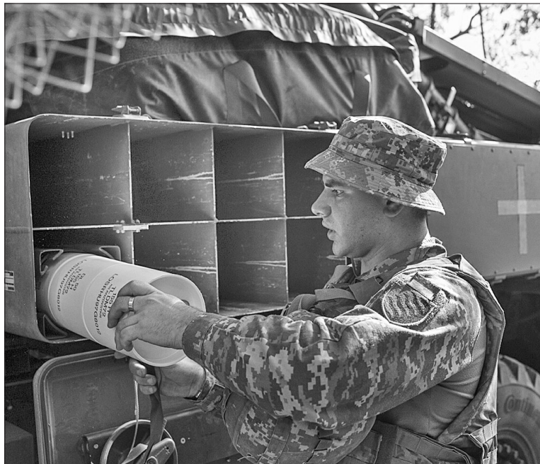
Рухомих ворожих цілей для наявних боеприпасів не бракує

Людмила КЛИЩУК, АрміяInform, онлайн-медіа Міноборони