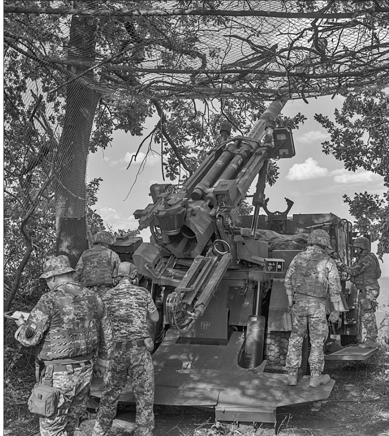
Розрахунок гармати щодня працює в режимі 24 на 7

«Ворожі колони йдуть невпинно, і до атак на наші позиції загарбники вдаються щодня. Завичай зупиняємо. Та, на жаль, трапляється й так, що ворожі підрозділи прориваються. Ми здебільшого працюємо по рухомих цілях: танки, БМП, МТ-ЛБ, БТР, багі. Зупиняємо все, що рухається на нас. Тому загалом наша бригада знищила безліч одиниць бронетехніки рашистів», — розповідає «Фіат» про бойові будні та вже набутий досвід.