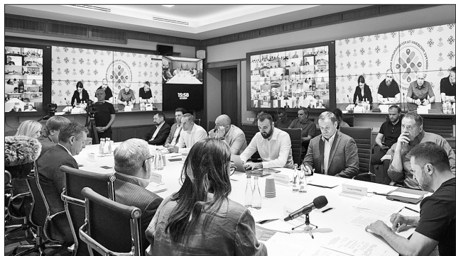
Учасники засідання наголосили, що всі інструменти державної підтримки мають бути доступні, прозорі, зрозумілі та максимально прості

Президент переконаний: розв'язання питань енергетики має бути комплексним і потребує як сильної протиповітряної оборони, так і