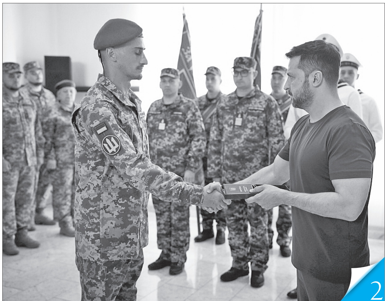
РОБОЧА ПОЇЗДКА. Президент в Одесі привітав військових моряків та відзначив їх державними нагородами